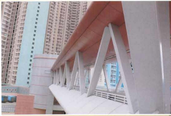
Footbridge Claddings at Yau Tong Redevelopment Phase 5 油塘重建第五期行人天橋覆面工程