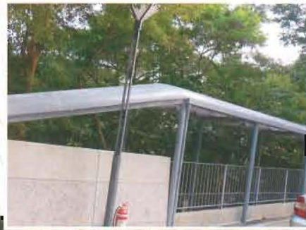
DBS Primary School Mini-step GRP Cover 拔萃男小學行人路上蓋工程

此工程承蒙拔萃男小學委托本公司設計、製造及安裝玻璃纖維行人路上蓋。此設計除了配合學校原有沈實不華的基本需求外，更突顯玻璃纖維上蓋的優美及耐用的特性。